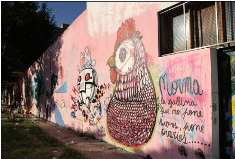
Escuela N°5 (calle 8 y 76)