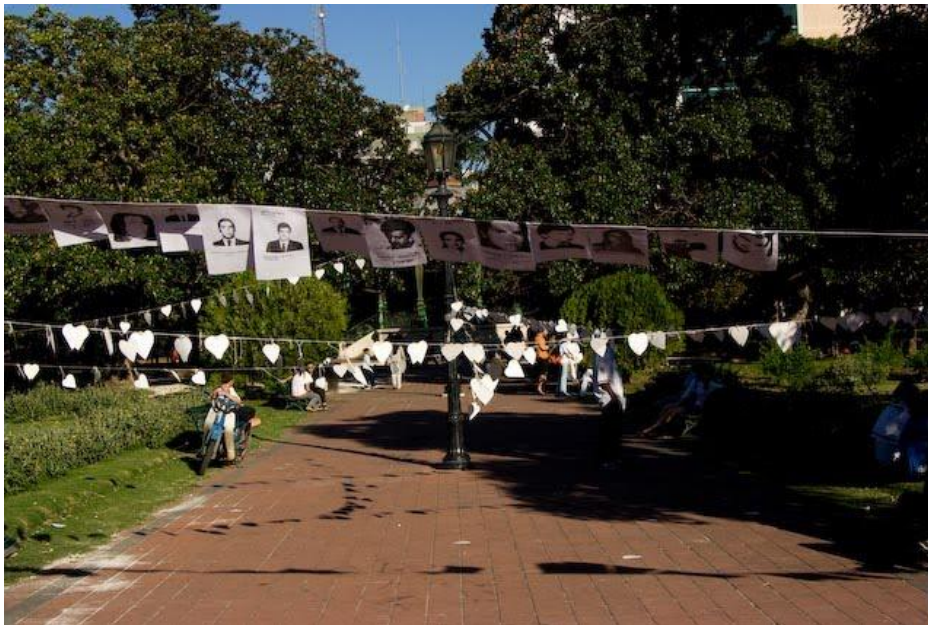
Figura 6: Plaza San Martín de La Plata con la instalación de Corazones. 23 Marzo 2010.

Lapráctica conocida como el Siluetazo , realizada en el año 1983 fue, por sus repercusiones, una de las acciones artístico – políticas más recordadas de Argentina y puede considerarse antecedente de la acción “30.000 corazones por el camino de la memoria”, realizada por el colectivo Ardeminga durante los meses de febrero, marzo y abril de 2010. Los autores del Siluetazo se propusieron hacer 30.000 siluetas de tamaño natural y pegarlas en paredes, árboles y monumentos del microcentro porteño, aledaño a la emblemática Plaza de Mayo. Ardeminga decidió realizar 30.000 corazones y colgarlos el día 24 de marzo, aniversario del golpe de estado del año 1976, en una estructura de alambre en la Plaza San Martín de La Plata, ámbito habitual de marchas y reclamos en la provincia de Buenos Aires.