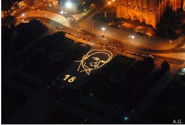
Figura 4. Jorge Pujol: Efigie de Julio López con velas. Plaza Moreno, La Plata, 2008.

Estos recursos visuales proliferan en reclamos desarrollados en el espacio público de las ciudades más importantes del país. Remiten, indudablemente, a instaurar desde la imagen completa de Julio López, la efigie sintetizada, el signo de interrogación, el rostro con cintas adhesivas sobre la boca aludiendo al silencio, una denuncia a la impunidad y un sostén de la memoria. En el caso de las velas encendidas funcionaron como metáfora de la luz de esperanza en la búsqueda de justicia y en la forma de mantener viva la presencia. Si bien el recurso es simple, sintetiza significaciones imaginarias muy fuertes en el seno de la sociedad. Un artículo firmado por Chempes , da cuenta de todas las acciones que incluyen las diferentes utilidades de la efigie, las intervenciones y los grafitis del caso Julio López. El texto fue publicado en Indymedia, 13 centro de información que tiene como premisa la libre difusión de información ausente en los medios masivos tradicionales. Una cantidad importante de datos sobre movilizaciones, marchas y acciones están incluidas en esta página de la web y añade múltiple información que excede las consideraciones de este artículo.