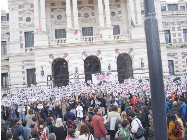
Figura 2. Colectivo Siempre en una marcha frente a la Casa de Gobierno de La Plata, calle 6 entre 51 y 53. 18 de marzo de 2007

con una gorra, realizada mediante el esténcil en color rojo sobre blanco y negro y también plasmaron los signos de interrogación en pancartas con el mismo formato [Figura 2]. Es de destacar que en los primeros dos años se realizaron veintiocho marchas que incluían acciones, recorriendo sitios emblemáticos vinculado al poder político tanto municipal como provincial.