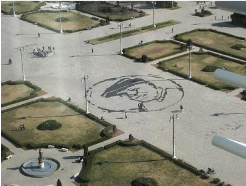
Figura 3. H.I.J.O.S. Efigie de Julio López en Plaza Moreno, La Plata, 2008.

Para quienes no se hallan familiarizados con la ciudad es preciso citar que la Plaza Moreno es el centro neurálgico y también geográfico de la cuadrícula que ha determinado el diseño de La Plata, espacio de convocatorias permanentes tanto de carácter político como de interacción social y comunal.