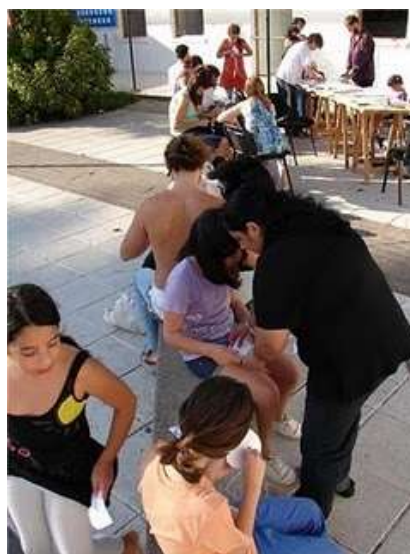
Maratón en un Centro cultural

“El material para realizar los corazones se consiguió por una donación de las gráficas e imprentas de La Plata, que en total donaron 6000 pesos en papel. Nos juntábamos en el Centro Cultural Islas Malvinas, en la vieja Estación Provincial, en casas particulares, en Radio Estación Sur, y cuando las personas lo hacían por su cuenta nosotros les dábamos la plantilla, el papel y el hilo y cuando estaban listos los pasábamos a buscar” 3