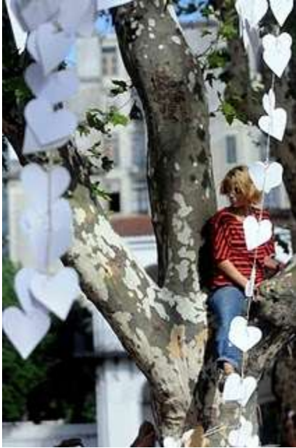
Plaza de Mayo