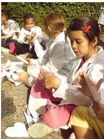
Maratón en una escuela

convocantes, “maratones” para hacer corazones en diversos lugares de La Plata, luego se fueron sumando otros puntos del conurbano bonaerense, e incluso intervinieron algunas instituciones del sur del país que mandaron sus producciones por correo. Invitaron a personas de diferentes edades y procedencias: escuelas primarias y secundarias, centros culturales y barriales, agrupaciones de Derechos humanos y también hogares de ancianos fueron convocados por cadenas de mail y por el “boca a boca”. Los autores consideran que participaron más de 3.000 personas en la realización de esta obra.