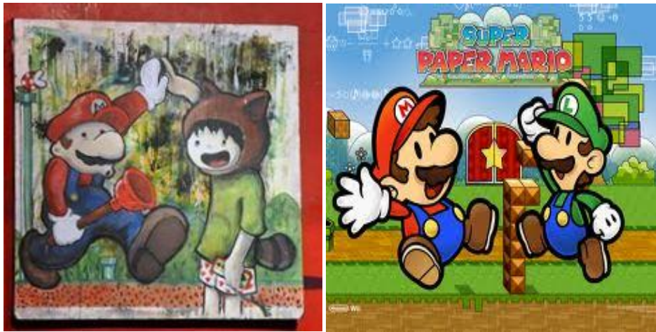
Izquierda: Pintura de Cons Kamikaze con apropiación de la figura de Súper Mario Bros. Derecha: Póster original de Súper Mario Bros.

“Traslado a mi obra las temáticas de mi infancia, los videos juegos clásicos de la Family Como la estética japonesa, Hora ventura, súper campeones, animación, etc.”