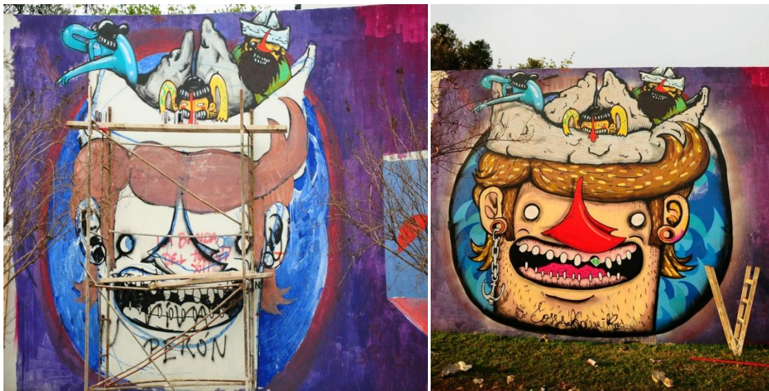
Proceso de trabajo: Mural en la vía pública hecho con látex y aerosol.

manera, pero conservando cada una su particularidad y cada artista firma su obra. Según la ocasión, el encargo, o la pared, a veces hacen bocetos previos que generalmente son individuales. Los proyectos colectivos no consisten en diseñar las imágenes a pintar de manera grupal, sino que cada uno plasma en la pared lo que quiere. La acción de pintar en grupo suele ser interpretada como una performance colectiva, con lo cual la obra no es sólo lo que queda plasmado en la pared sino toda la actividad previa donde se desarrolla la acción, con espíritu festivo y amigable. Cuando les hacen encargos, tanto al grupo de artistas amigos o de manera individual, el mayor rédito económico consiste en quedarse con los sobrantes de pintura (comprados por el que encarga la obra). Pintura que después devuelven a la calle pintando muros públicos por los que sienten algún tipo de atracción, ya que según las palabras del propio Cons: “El graffiti no es un hobby para nada barato” .