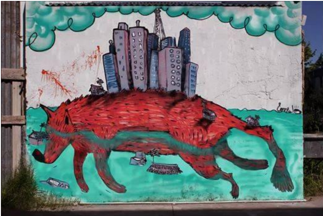
Mural en alusión a la inundación del 2 de abril de la sede Fonseca, FBA. Pintura látex y aerosol.

trabajar para grupos políticos. Hay una obra realizada en la Facultad de Bellas Artes sede Fonseca, que adquiere testimonio de lo que paso en La Plata con la inundación del 2 de Abril del 2013, un tema que lo marcó profundamente. Se realizó una campaña con esta temática, realizada por un grupo militante que lo convocó, sin embargo el tema según el artista amerita un compromiso social de todos, porque la Ciudad en su conjunto fue afectada, no solo la adhesión de un grupo militante. La obra la realizo, sin ninguna bandería política.