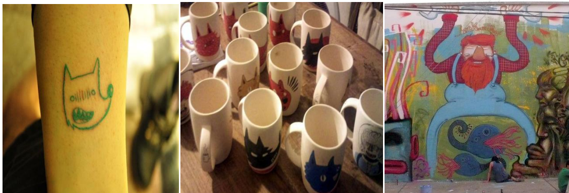
Soportes varios: Iz.: Tatuaje. Centro: tazas de cerámica. Der.: Mural en la vía pública con látex y aerosol.

Su experiencia atraviesa todos los soportes, es un gran desafío para él, utilizar desde intervención de objetos, paredes, papel, digital, stickers, fotografía, hasta llegar al cuerpo a través del tatuaje, en él que mantiene su mismo estilo, y le reditúa bastante. Tiene cientos de bocetos que conserva incluso desde la época de la escuela secundaria. “Mi obra no está ligada a un soporte, ninguna especialidad específica, me gusta incursionar en distintos formatos y soportes”.