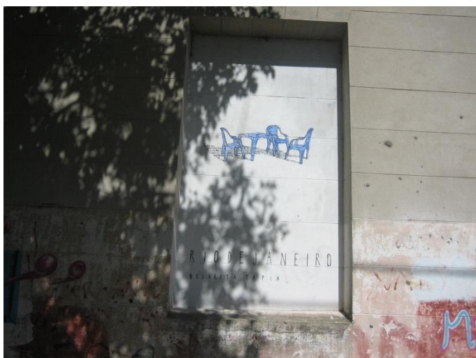
23 (65 y 66) "riodejaneiro" pared trasera edificio Seminario San José

seguir esto y se va armando. Trato de elegir el recurso en función de lo que quiero decir". Optó por encuadrar sus trabajos dentro del formato rectangular y vertical de las ventanas seleccionadas como soporte de sus pinturas. Son todos muy similares en tamaño y formato. Se perciben como cuadros exhibidos en la vía pública, cuyo cimiento es la pared y su contorno el perímetro de la ventana.