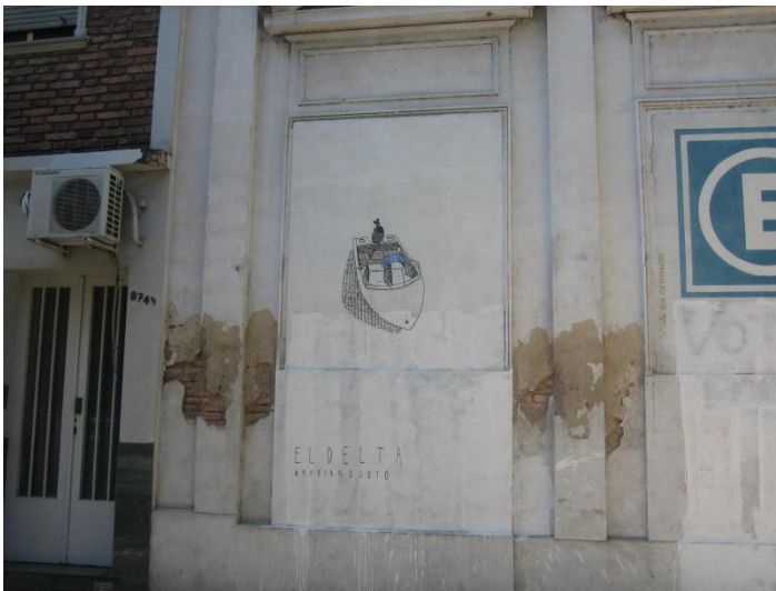
63 n° 874 y 1/2 (12 y 13) “ el delta ” Muro exterior cochera

Los trabajos que componen la serie “Paseo de verano” fueron concebidos como obras efímeras, dibujos pintados con témpera sin ninguna protección, es decir que la búsqueda de priorizar la idea y el proceso sobre la permanencia de la obra estaba presente. “La idea en realidad era que paseo de verano fuera de verano nada más. Compré témperas porque quería que la tormenta de verano borrara y que solamente durara durante el verano y que no fuera