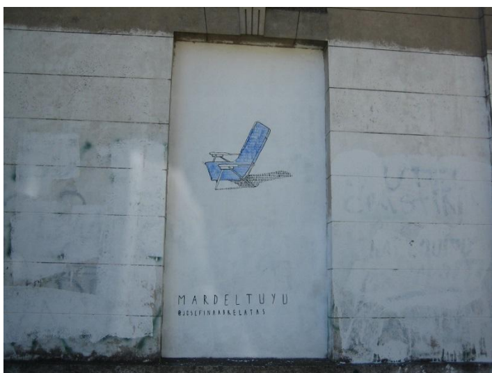
25 y 501 “mardeltuyu” casa abandonada