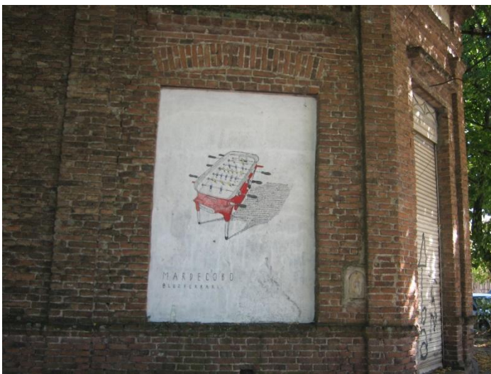
22 y 65 “mardecoco” casa particular abandonada