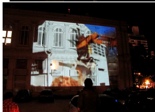
3 y 4- Registro fotográfico de la proyección realizada en la fachada del Rectorado.